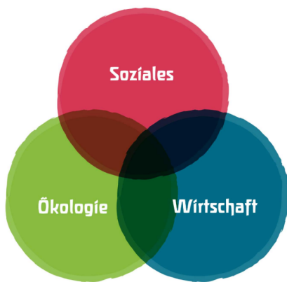
Drei-Säulen-Modell der Nachhaltigkeit

Nachhaltigkeit oder nachhaltige Entwicklung bedeutet, die Bedürfnisse der Gegenwart so zu befriedigen, dass die Möglichkeiten zukünftiger Generationen nicht eingeschränkt werden.